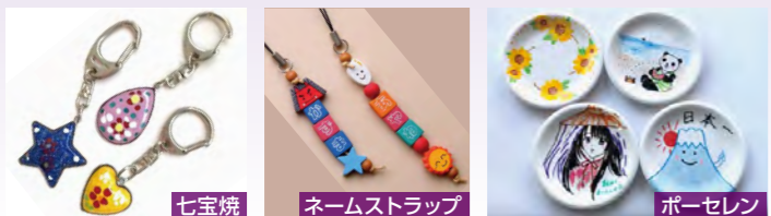
七宝焼 ネームストラップ ポーセレン

人気No.1の七宝焼をはじめ、様々な手づくり体験が楽しめます。世界に一つだけのオリジナル作品を作ってみませんか？ ※団体向けメニューもございます。10名様以上でご利用の場合、2週間前までにご予約ください。