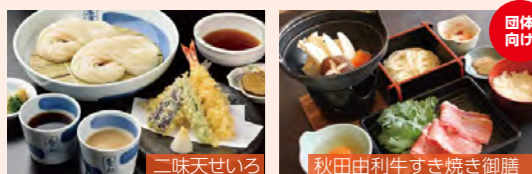
二味天せいろ 佐藤養助 横手店 秋田由利牛すき焼き御膳 味処みのり

稲庭うどん、きりたんぼ鍋など、秋田ならではの「ふるさと」の味をお召し上がりください。グループ、団体のお食事予約も承っております。お気軽にご相談ください。